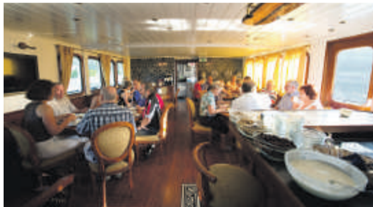
Gestärkt auf die Tour: Frühstück auf der MS Magnifique

Die Reise wurde von Eurotrek unterstützt