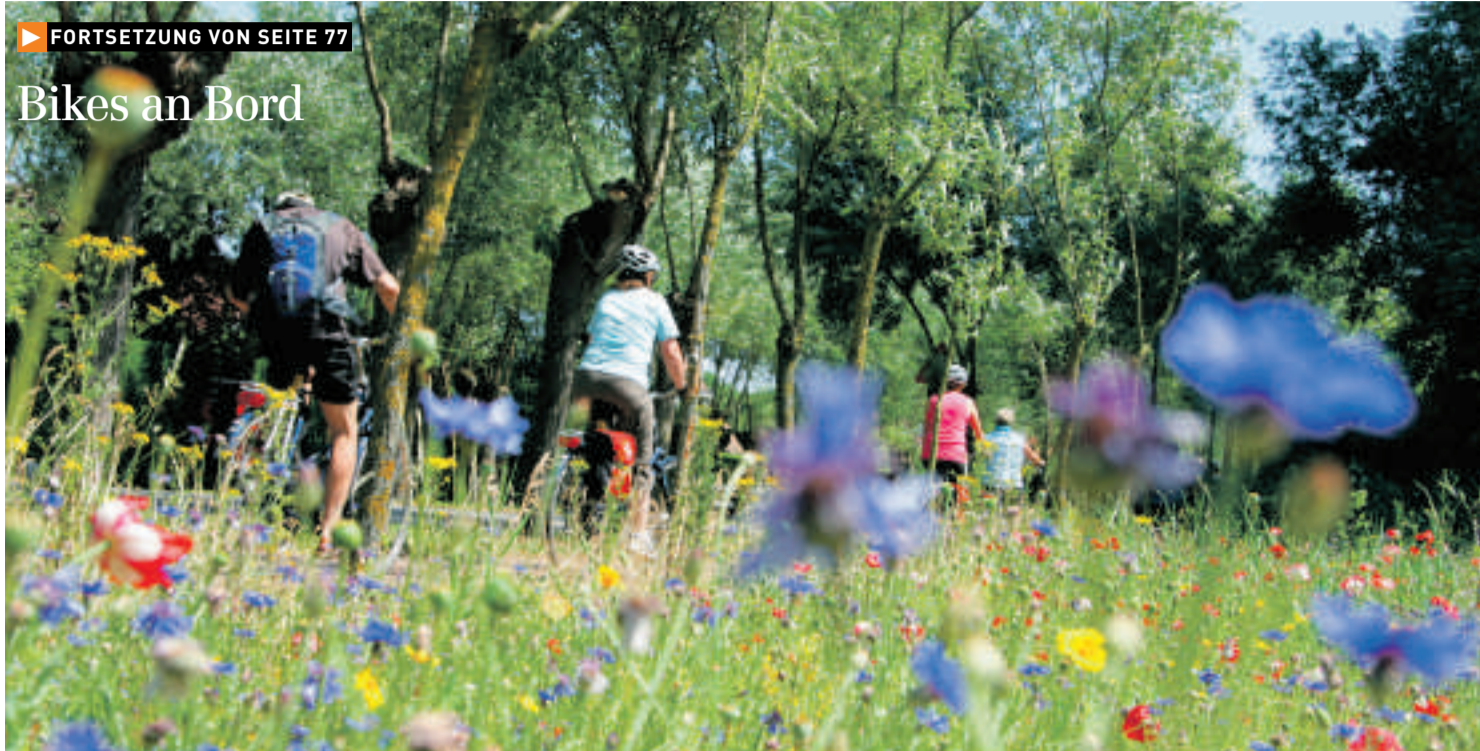
Blühende Landschaften: Auch wer des Kartenlesens unkundig ist, findet sich auf den Strasse zurecht